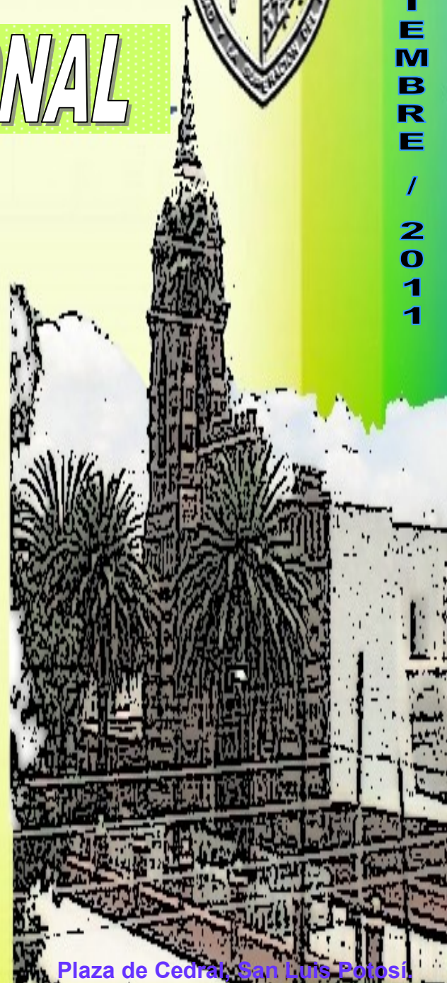
Plaza de Cedral, San Luis Potosí